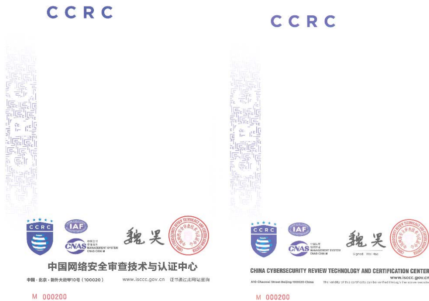
信息安全管理体认证证书

CCRC 获准颁发的体系认证证书包括信息安全管理体认证证书、信息技术服务管理体系认证证书、质量管理体系认证证书，业务连续性管理体系认证证书，共四种证书。其中，管理体系认证证书包括带有 CNAS 认可标志和国际互认标志 IAF、带有 CNAS 认可标志和不带认可标志三种，如图标 1 所示：