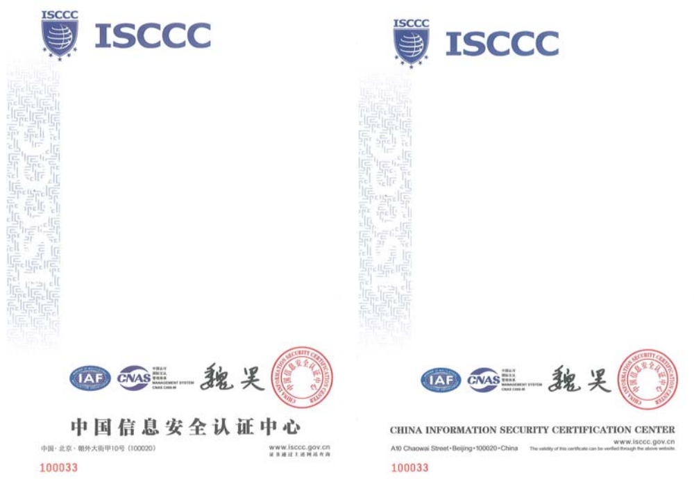
信息安全管理体认证证书

ISCCC 获准颁发的体系认证证书包括信息安全管理体认证证书、信息技术服务管理体系认证证书、质量管理体系认证证书，业务连续性管理体系认证证书，共四种证书。其中，管理体系认证证书包括带有认可标志和不带认可标志两种，如图标 1 所示：