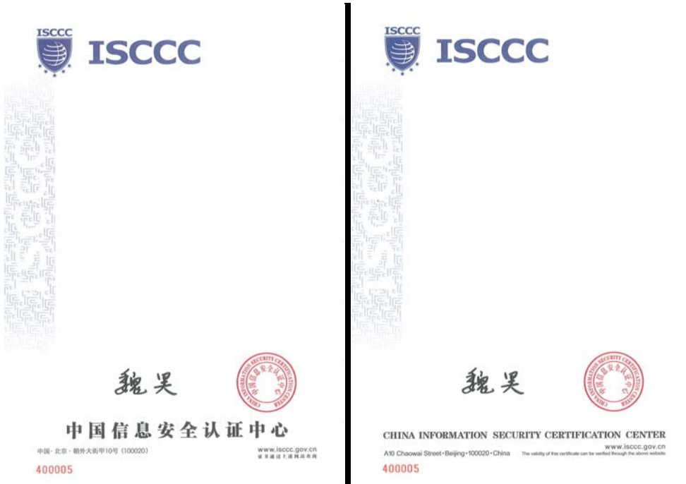
业务连续性管理体系认证证书