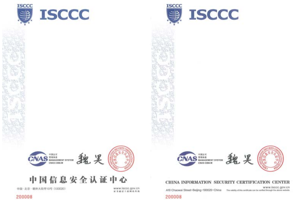
信息技术服务管理体系认证证书