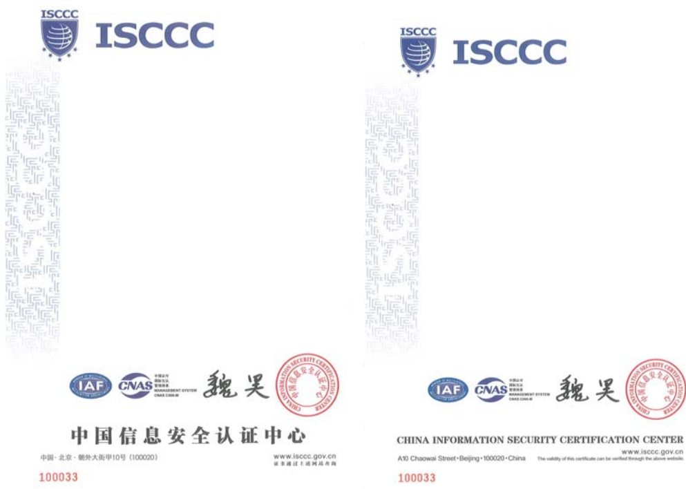
质量管理体系认证证书